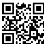
Praktijkvoorbeeld Papagaii vliegt weg