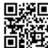
Praktijkvoorbeeld Redding kinderen uit boom