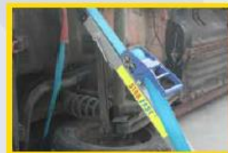
7. Span nu alle stabfasten aan.