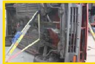
3. Plaats aan de voorzijde onder de motorruimte een stabfast.