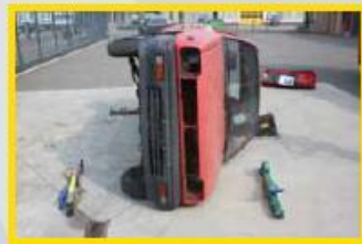
2. Leg de stabfast op de juiste plaats: geel/groen aan voorzijde auto; blauw aan achterzijde auto.