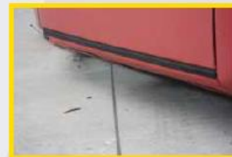
8. Verwijder indien nodig de noodstabilisatie.