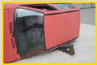
1. Plaats stophout onder de zijkant van de auto.