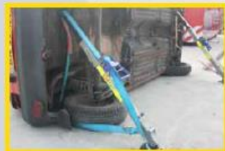
6. Plaats de stabfast aan de achterzijde ter hoogte van de kofferbak en koppel de spanband aan de wig.