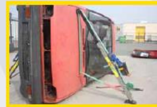
4. Plaats aan de voorzijde tegen de motorkap een stabfast.