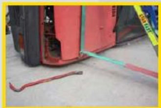
5. Alternatief: Haak de stabfast in de rand van de motorkap i.p.v. dóór de motorkap.