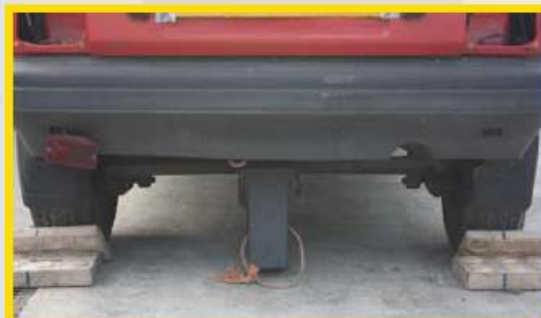
4. Eventueel kan er nog een stabilisatieblok onder de achterzijde.