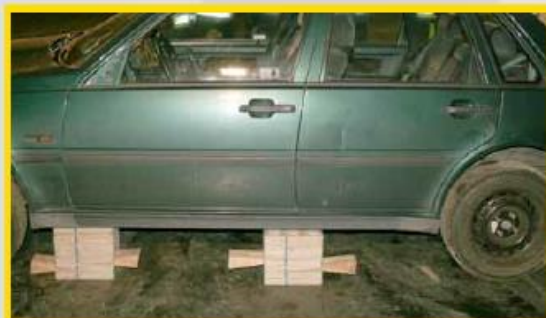
3. Plaats stabilisatieblokken onder de dorpel ter hoogte van de B-stijl (goed afzetpunt B-post rib off / dashroll).