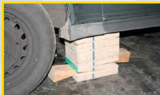
2. Plaats stabilisatieblokken onder de dorpel ter hoogte van de A-stijl (goed afzetpunt dashlift).