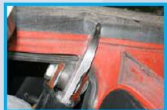
5. Knip de dorpel (achterportier) door tot op de bodemplaat, zo dicht mogelijk bij de B-stijl (eerste knip van binnenuit).