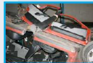
8. Trek de complete zijkant op de onderkant van het voertuig. Zet deze zijkant met een touw of spanband vast.