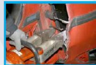
4. Open het portier aan de scharnierzijde met spreider of schaar.