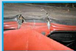
6. Knip de dorpel (voorportier) door tot op de bodemplaat, zo dicht mogelijk bij de B-stijl (eerste knip van binnenuit).