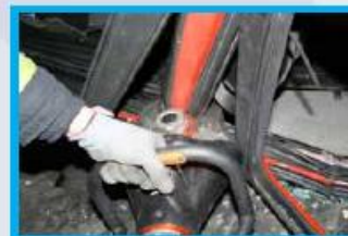
7. Knip de B-stijl ter hoogte van het dak door.