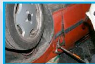
3. Maak ruimte bij het voorportier aan de scharnierzijde.