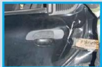
1. Creëer ruimte bij het achterportier.