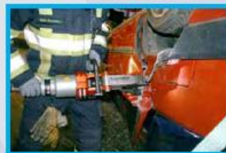
2. Open het portier met een spreider. Knip bij voldoende ruimte het slot door.