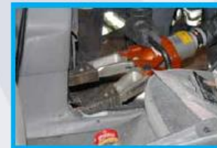
4. Plaats spreider op de dorpel en tegen het portier.