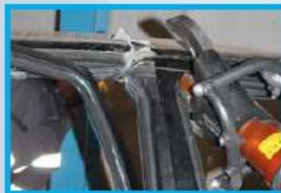
6. Knip de B-stijl boven door in een V of horizontaal aan het dak.