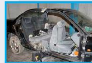
8. Zorg voor voldoende ruimte achter de scharnieren, zodat de schaar door de scharnieren kan glijden.