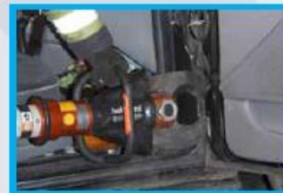
7. Knip nu de scharnieren van het voorportier door.