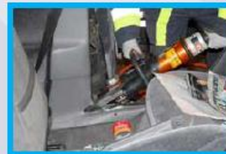
3. Knip horizontaal op de dorpel de B-stijl in.