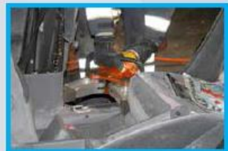
5. De B-stijl scheurt los van de dorpel. Scheurt de B-stijl te veel in de dorpel, dan opnieuw inknippen.