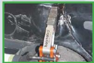
1. Maak ruimte om het achterportier te openen. Is de deur op normale wijze te openen met de klink, ga dan door naar stap 3.