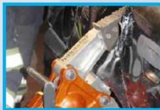
2. Open met schaar en/ of spreider het achterportier. Knip direct de deurvanger eruit.