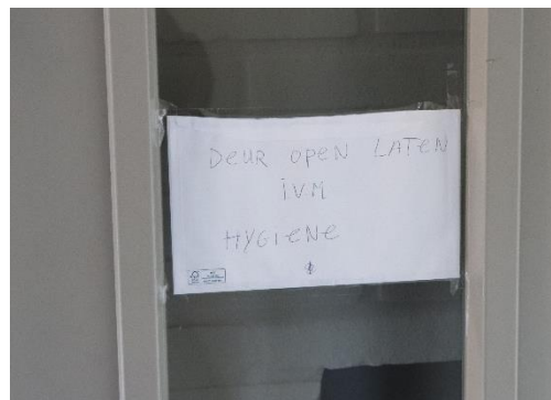
Briefje met vraag om deur niet te