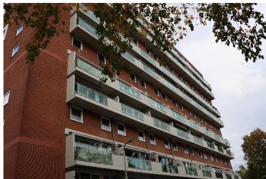
Voor aanzicht Flat