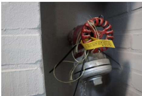
Touw om deur open te houden. Vastgemaakt aan drogestijgleiding