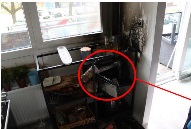
Ontstaanslocatie brand (rode cirkel)