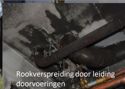
Rookverspreiding door leiding doorvoeringen

Op 19 januari 2019 is de brand met 1 bundel LD en op 26 september met 1 HD Offensief Binnen bestreden. In beide gevallen was het koelend vermogen voldoende en is de brand effectief en snel bestreden. Tijdens beide inzetten komt de Brandweer er na verkenning achter dat er rookverspreiding heeft plaatsgevonden op de verdiepingen 1 t/m 6 en dat er CO hangt in de woningen en in de centrale hal op de verdiepingen 13 t/m 16. Dit tot een niveau van 200 ppm een uur na de brand. Bij beide inzetten is er opgeschaald naar zeer grote brand, is het pand volledig ontruimd en zijn de bewoners opgevangen in een naastgelegen buurthuis. Tijdens beide inzetten zijn een aantal bewoners nagekeken op rookinhalatie door de Ambulances. Bij beide inzetten is er één bewoner meegenomen naar het ziekenhuis voor controle.